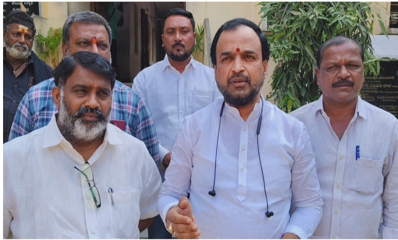
తెలంగాణవీణ - కూకట్ పల్లి