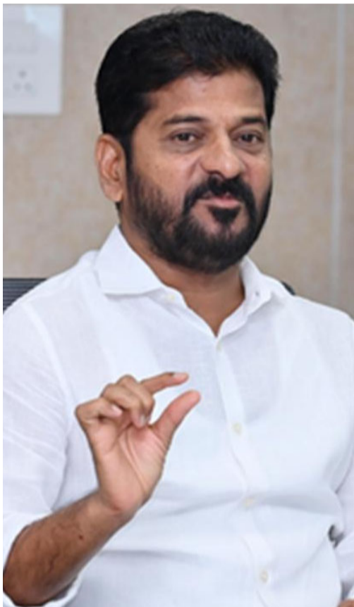
హైదరాబాద్, నవంబర్ 28 (తెలంగాణ పీఠ):

విద్యార్థులకు పరిశుభ్ర వాతావరణంలో పాఠ్యాభ్యాసం అందించాలని సీఎం రేవంత్ రెడ్డి జిల్లా కలెక్టర్లను ఆదేశించారు. తరచూ స్కూళ్లు, గురుకులాలను తనిఖీ చేయాలన్నారు. వసతి గృహాల్లో ఆహార కల్తీకి బాధ్యులైనవారి వేటు వేయాలని స్పష్టం చేశారు. ప్రభుత్వ పాఠశాలలు, వసతిగృహాలు, గురుకుల స్కూళ్లలో ఉన్న విద్యార్థులను కన్న బిడ్డలా చూడాలని, వారికి పరిశుభ్రమైన వాతావరణంలో పాఠ్యాభ్యాసం అందించడంలో ఎటువంటి అలక్ష్యానికి తావు ఇవ్వవద్దని ముఖ్యమంత్రి రేవంత్