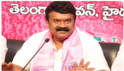
తెలంగాణ వీణ, హైదరాబాద్

నిర్మల్ జిల్లా దిలావర్పూర్లో ప్రతిపాదించిన ఇథనాల్ కంపెనీకి, తమ కుటుంబానికి ఎలాంటి సంబంధం లేదని మాజీ మంత్రి, బీఆర్ఎస్ ఎమ్మెల్యే తలసాని శ్రీనివాస్ యాదవ్ అన్నారు. తమకు వాటాలున్నాయని మంత్రులు, కాంగ్రెస్ ఎమ్మెల్యేలు, పీసీసీ అధ్యక్షుడు అబద్ధాలు మాట్లాడుతున్నారని ఆగ్రహం వ్యక్తం చేశారు. మాకు వాటాలున్నాయని నిరాపిస్తే వాళ్లకే రాసిస్తానని చెప్పారు. ఇథనాల్ కంపెనీ వద్దని అక్కడి గ్రామస్థులు ధర్మాలు చేస్తున్నారని, దానిపై ప్రభుత్వం ప్రజలకు సమాధానం చెప్పాలన్నారు. పార్టీ ఎమ్మెల్యేలతో కలిసి ఆయన మీడియాలో మాట్లాడారు. రాజమండ్రి దగ్గర ఒక డిస్ట్రీబ్యూట్ కంపెనీలో 8 మంది రైతెళ్లలో ఒకరిగా నా కుమారుడు ఉన్నారని, 2016లోనే దానికి రాజీనామా చేశాడన్నారు. అదే ఏడాది ఇథనాల్ ఫ్యాక్టరీ ఏర్పాటుకు ఏపీలో ఒప్పందం కుదిరిందని, ఆ తర్వాత దానిని రద్దు చేసుకున్నారని తెలిపారు. పాత పేపర్ పట్టుకుని తమపై అసత్య ప్రచారం చేస్తున్నారని మండిపడ్డారు. ఇథనాల్ కంపెనీ రాష్ట్ర ప్రభుత్వానికి సంబంధం లేదన్నారు. దానికి కేంద్ర పర్యావరణ మంత్రిత్వ శాఖ అనుమతి ఇచ్చిందని, రాష్ట్ర ప్రభుత్వం అనుమతి ఇచ్చినట్లు తప్పుడు ప్రచారం చేస్తున్నారని విమర్శించారు. బీఆర్ఎస్ పార్టీపై బురదజల్లుతున్నారని ఆగ్రహం వ్యక్తం చేశారు. రాజకీయాల్లో విమర్శలు ప్రతి విమర్శలు సహజమన్నారు. లగనరైతల్లో కేటీఆర్ కుట్ర చేశారని అభిప్రాయం వ్యక్తం చేశారు. రాజకీయాల్లో విమర్శలు ప్రతి విమర్శలు సహజమన్నారు. లగనరైతల్లో కేటీఆర్ కుట్ర చేశారని అభిప్రాయం వ్యక్తం చేశారు. రాజకీయాల్లో విమర్శలు ప్రతి విమర్శలు సహజమన్నారు. లగనరైతల్లో కేటీఆర్ కుట్ర చేశారని అభిప్రాయం వ్యక్తం చేశారు. రాజకీయాల్లో విమర్శలు ప్రతి విమర్శలు సహజమన్నారు. లగనరైతల్లో కేటీఆర్ కుట్ర చేశారని అభిప్రాయం వ్యక్తం చేశారు.