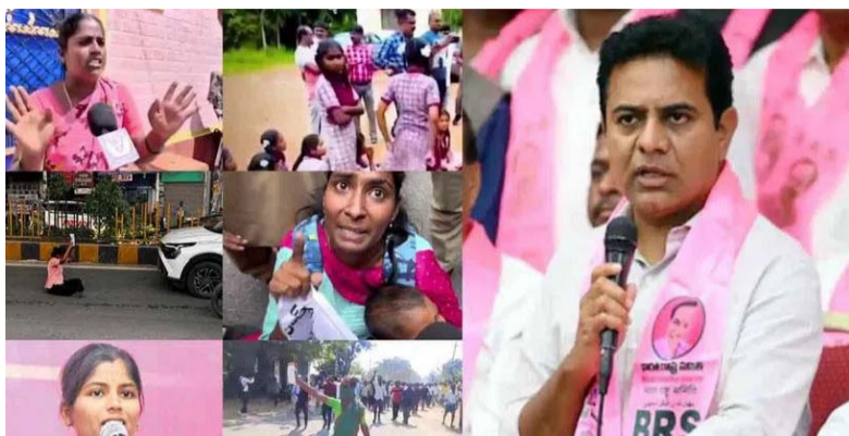
దిలావర్పూర్లో దమనకాండ సృష్టించి, రామన్నపేటను రాజకీయాలు చేసి లగనరైతలను జైలుపాలు చేసి అల్లుడి కళ్లలో ఆనందం చూసినందుకా

మెరుగైన తెలంగాణ కోసం సోదరుడిగా మీ పోరాటానికి అందగా ఉంటానని ట్వీట్ చేశారు. అబద్ధానికి అంగీ.. లాగు వేస్తే అది కాంగ్రెస్ ప్రభుత్వం విజయోత్సవాలు దేనికి చేస్తున్నారని సీఎం రేవంత్ రెడ్డి ప్రభుత్వాన్ని బీఆర్ఎస్ వర్కింగ్ ప్రెసిడెంట్ కేటీఆర్ ప్రశ్నించారు. సిగ్గు లేరా జీడిగింజా అంటే.. నల్లగున్న నాకేం సిగ్గు అవుతుంది అనేచందంగా కాంగ్రెస్ సర్కార్ తీరు ఉందని ప్రేరయ్యారు. రైతు భరోసాకు ఎగనామం పెట్టి, రుణమాఫీ పేరుతో పంగనామాలు పెట్టారని, పంటల కొనుగోళ్లకు శరణింపం పెట్టి, దాన్యానికి క్వింటాలుకు రూ.500 టోనస్ ఎగ్గొట్టడంని ఆరోపించారు.