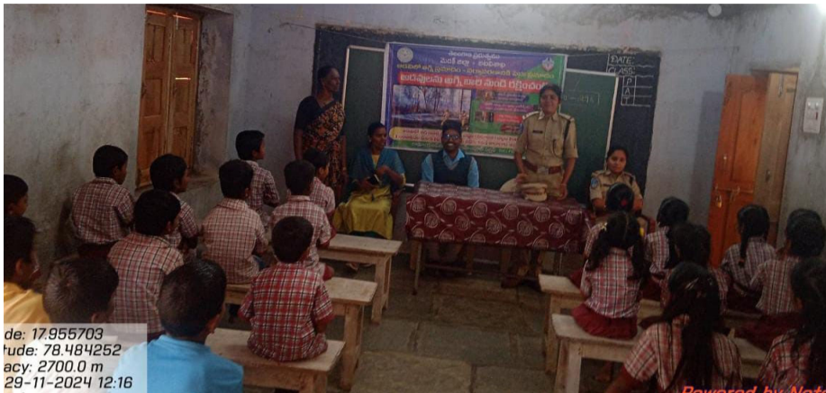
de: 17955703 tude: 78.484252 ogy: 2700.0 m 29-11-2024 12:16