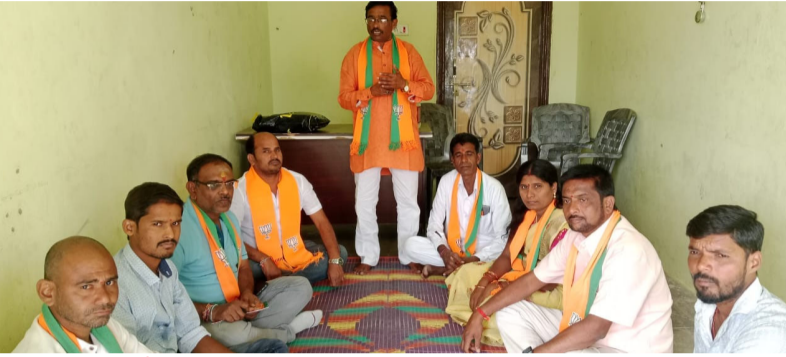
తెలంగాణ వీణ/యాదగిరి గుట్ట: