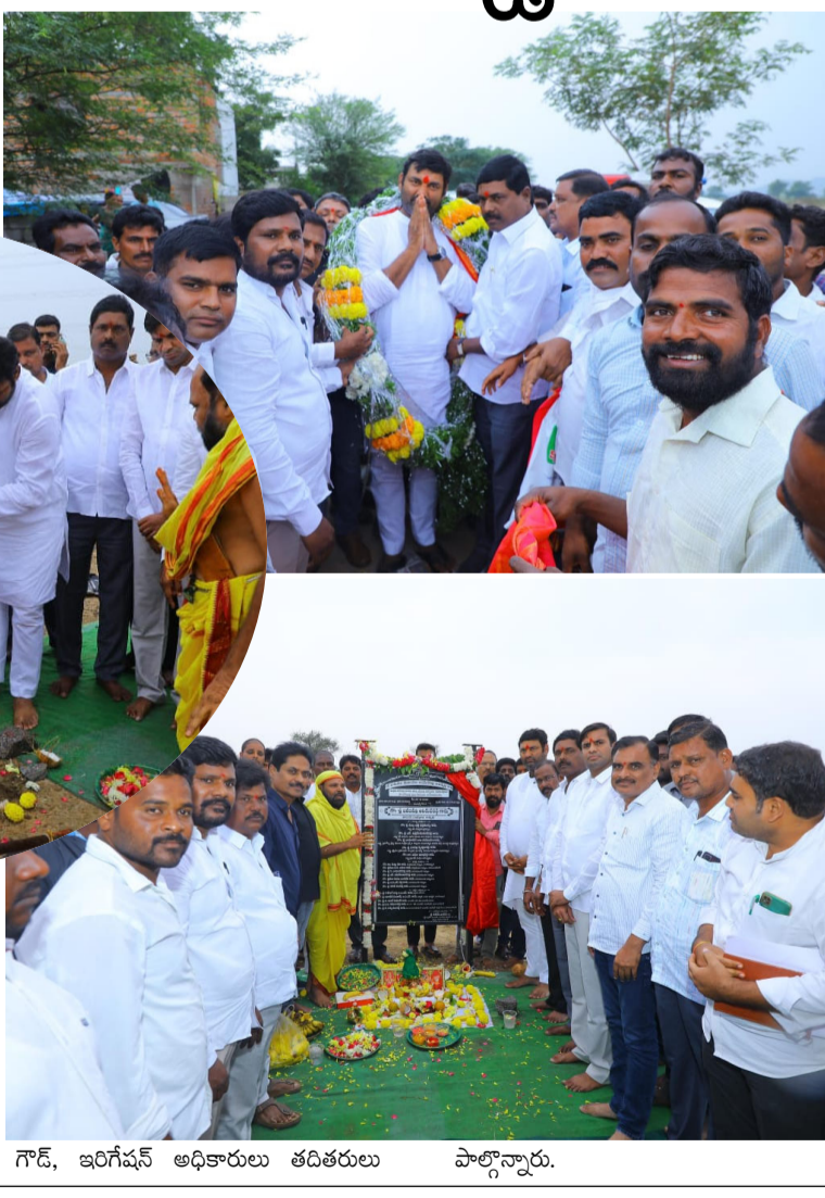
గౌడ్, ఇరిగేషన్ అధికారులు తదితరులు పాల్గొన్నారు.

31,544 మందికి మొత్తంగా 259 కోట్ల రుణమాఫీ జరిగిందన్నారు. గత ప్రభుత్వ పాలనలో మాజీ ఎమ్మెల్యే మొత్తంగా రోడ్ల నిమిత్తం పదేళ్లలో 93 కోట్లు తీసుకొన్నా. నేను మొదటి సంవత్సరంలోనే 153 కోట్లు తీసుకొచ్చానని తెలిపారు. ఈ విధంగా పంపిణీ