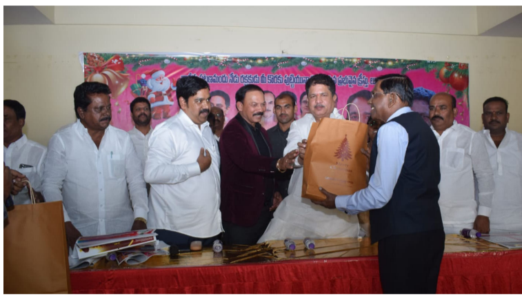
తెలంగాణవీణ - కూకట్ పల్లి...

తెలంగాణ రాష్ట్ర తొలి ముఖ్యమంత్రి కేసీఆర్ ఆధ్వర్యంలో, గత పది సంవత్సరాలుగా అన్ని మతాల పండగలకు బట్టలు పంపిణీ చేసిన ఘనత, తెలంగాణ తొలి ముఖ్యమంత్రి కేసీఆర్ కే దక్కుతుంది