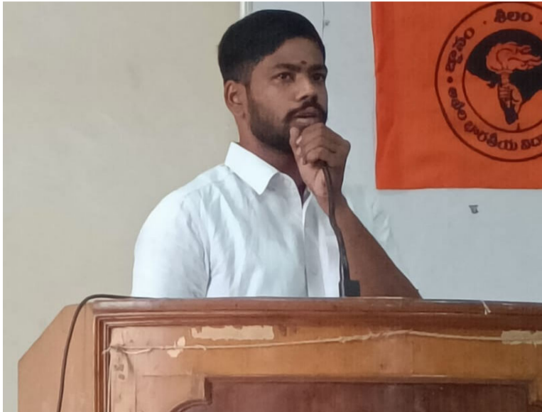
నోటిఫికేషన్లు కావాలి కాబట్టి ఇలాంటి రాజకీయ పార్టీల సభలకు మరోసారి ఆసుమతులొచ్చేది లేదు. ఒకవేళ ఇది మళ్ళీ పునరావృతం అయితే ఉస్మానియా

స్కాలర్షిప్ బకాయిలు ఇలా ఎన్నో సమస్యలున్నాయి వీలైతే వాటిని ప్రభుత్వాల దృష్టికి తీసుకెళ్ళి వాటిని పరిష్కరించాలి అవసరం ఉంది. నిన్న జరిగినటువంటి నిరుద్యోగ కృతజ్ఞత సభ రాజకీయ నిరుద్యోగులు వారి వారి స్వలాభం కోసం చేసుకున్నవే తప్పితే యూనివర్సిటీ లోని విద్యార్థులకు ఎలాంటి లాభం లేకపోవని విద్యా వాతావరణాన్ని చెడగొడుతున్నవి గత పది సంవత్సరాల్లో ప్రభుత్వాలు యూనివర్సిటీలపై చూపిన పిన తల్లి ప్రేమను ప్రస్తుత ప్రభుత్వం కూడా కొనసాగించుగా అదే విధంగా కొనసాగిస్తుంది. విద్యార్థులు కోరుకునేవి రాజకీయ నిరుద్యోగుల సభలు కాదు నిరుద్యోగితుల రూపుమాపు ఉద్యోగ