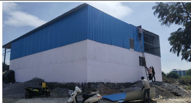
చర్లపల్లి నుంచి రాంపల్లి వెళ్లే దారిలో భారీ షెడ్డు