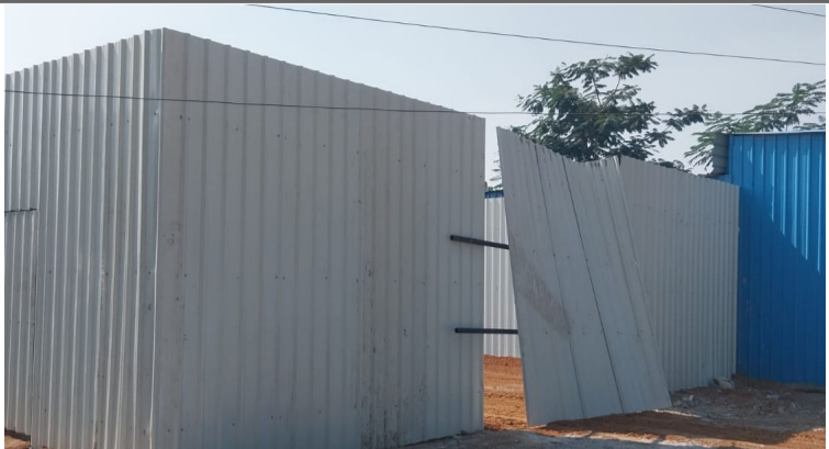
సత్యనారాయణ కాలనీ ప్రధాన రహదారి పక్కనే వెలుస్తున్న షెడ్డు