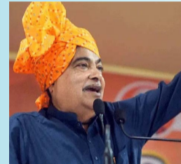
న్యూఢిల్లీ, డిసెంబర్ 19 (తెలంగాణ వీణ):

పార్లమెంట్ వద్ద గందరగోళ వాతావరణం సహ తోపులాటలో ఇద్దరు బిజెపి జీవనం ఎంపీలకు గాయాలు తప్పుడు విధానం ఇద్దరిని చికిత్స కోసం అస్పత్రికి తరలింపు కేంద్ర మంత్రి నితిన్ గడ్కర్ తమను కావాలనే అడ్డుకున్నారని రాహుల్ ఎదురుదాడి