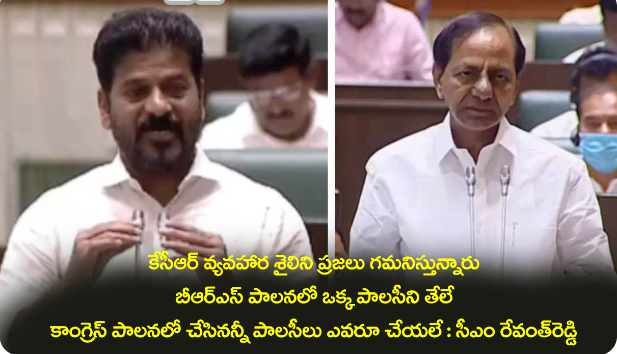
కేసీఆర్ వ్యవహార శైలిని ప్రజలు గమనిస్తున్నారు బీఆర్ఎస్ పాలనలో ఒక్క పాలసీని తేలే కాంగ్రెస్ పాలనలో చేసినన్నీ పాలసీలు ఎవరూ చేయలే : సీఎం రేవంత్ రెడ్డి

హైదరాబాద్, మార్చి 13 తెలంగాణ వీణ మాజీ సీఎం కేసీఆర్ చర్చకు రాకుండా గవర్నర్ ప్రసంగానికి వస్తే ఏం లాభమని సీఎం రేవంత్ రెడ్డి అన్నారు. ఒకవేళ చర్చకు వస్తే వారే చేసిన తప్పులేంటే వివరించే అవకాశం ఉంటుంది.. తద్వారా ప్రజలకు తెలుస్తుందిని ఆయన అభిప్రాయపడ్డారు. చర్చకు రాకుండా గవర్నర్ ప్రసంగానికి వస్తే అర్థం ఏంటని ప్రశ్నించారు. కేసీఆర్ వ్యవహార శైలిని తెలంగాణ ప్రజలు గమనిస్తున్నారని చెప్పాకొచ్చారు. ఢిల్లీ చర్చకుంటే ఉన్న సీఎం రేవంత్ రెడ్డి మీడియాతో చిట్ చాట్ నిర్వహించారు. ఈ సందర్భంగా రేవంత్ రెడ్డి మాట్లాడుతూ.. బీఆర్ఎస్ పక్షం పాలనలో కేసీఆర్ ఒక్క పాలసీ తేలేదన్నారు. తెలంగాణలో తాను చేసినన్నీ పాలసీలు