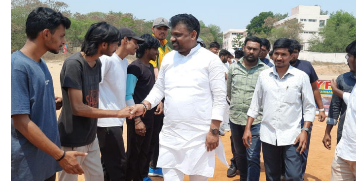
పురస్కరించుకుని ఉస్మానియా విశ్వవిద్యాలయం లోని క్రీకెట్ గ్రౌండ్లో

విద్యార్థులు, యువత చెడు వ్యవసాలకు దూరంగా ఉండాలని, ఆ వ్యాసనాల వల్ల అభినందించారు. క్రీడలు శరీర ఎదుగుదలకు, మానసిక స్థైర్యం పెంపుదలకు ఉపయోగపడుతుందని వారు అన్నారు. భగత్ సింగ్ కు మన దేశం ఏమీ చేసిందని... దేశానికి భగత్ సింగ్ చేసిన నిష్ఠార్థ సేవలను ఆలోచించకుండా... దేశానికి భగత్ సింగ్ అడుగుజాడల్లో నేటి యువత నడిస్తే సామాజిక న్యూన అలవర్చుకోవచ్చని వారు ఉద్ఘాటించారు. రాష్ట్ర ప్రభుత్వం క్రీడారంగాన్ని అభివృద్ధి పర్చడానికి కృషి చేస్తుందని వారు అన్నారు. విద్యార్థులు, యువత చెడు వ్యవసాలకు దూరంగా ఉండాలని, ఆ వ్యాసనాల వల్ల